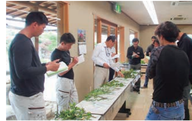
7月4日の旧要素準備講習会の状況 (講義の後、本試験の予行演習が実施される)