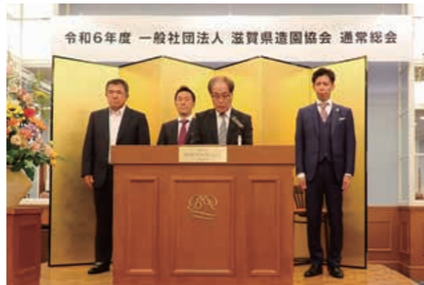
新執行部(正・副会長)