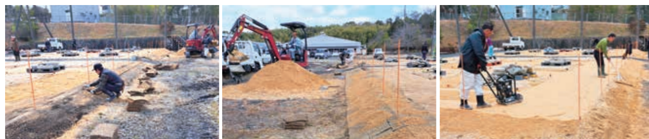
真砂土を搬入し凹凸のある会場の整地後に、法面の芝張が行われました(テクノカレッジ草津)

造園技能検定・準備講習会のテクノカレッジ草津会場では、移転当初から降雨により法面が崩れ、真砂土が流れ出るため、3月13日に職業訓練委員会で再整備(法面処理)が行われました。