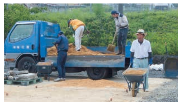
7月に実施した技能検定会場の整備

会員の皆様の積極的なご協力・ご参加のほど、職業訓練委員会を代表してお願い申し上げます。