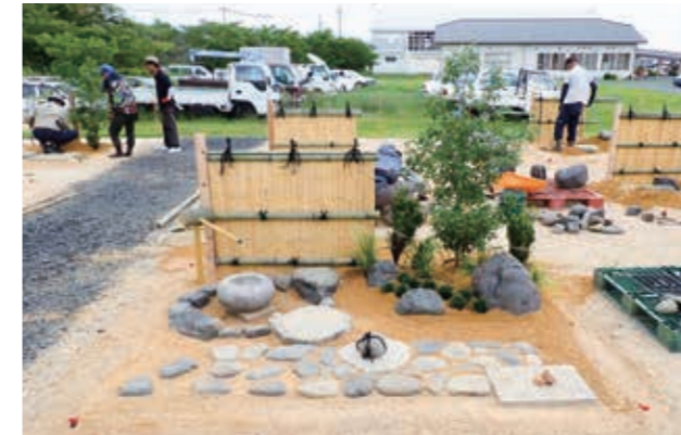
7月24日の実技準備講習会 (完成状況1級)

今年度も、技能検定に向けた実技の準備講習会が開催されました。幸い曇り空でしたが、講習会参加者の16名は、講師の指導の下、汗を拭いながら熱心に実技作業をこなしました。完成まで至らなかった講習生もいましたが、本試験まで練習を積むよう指導がありました。