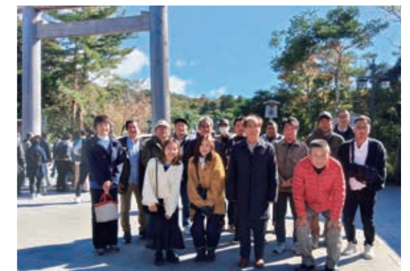
昨年度3年ぶりに実施した研修会(伊勢神宮にて)