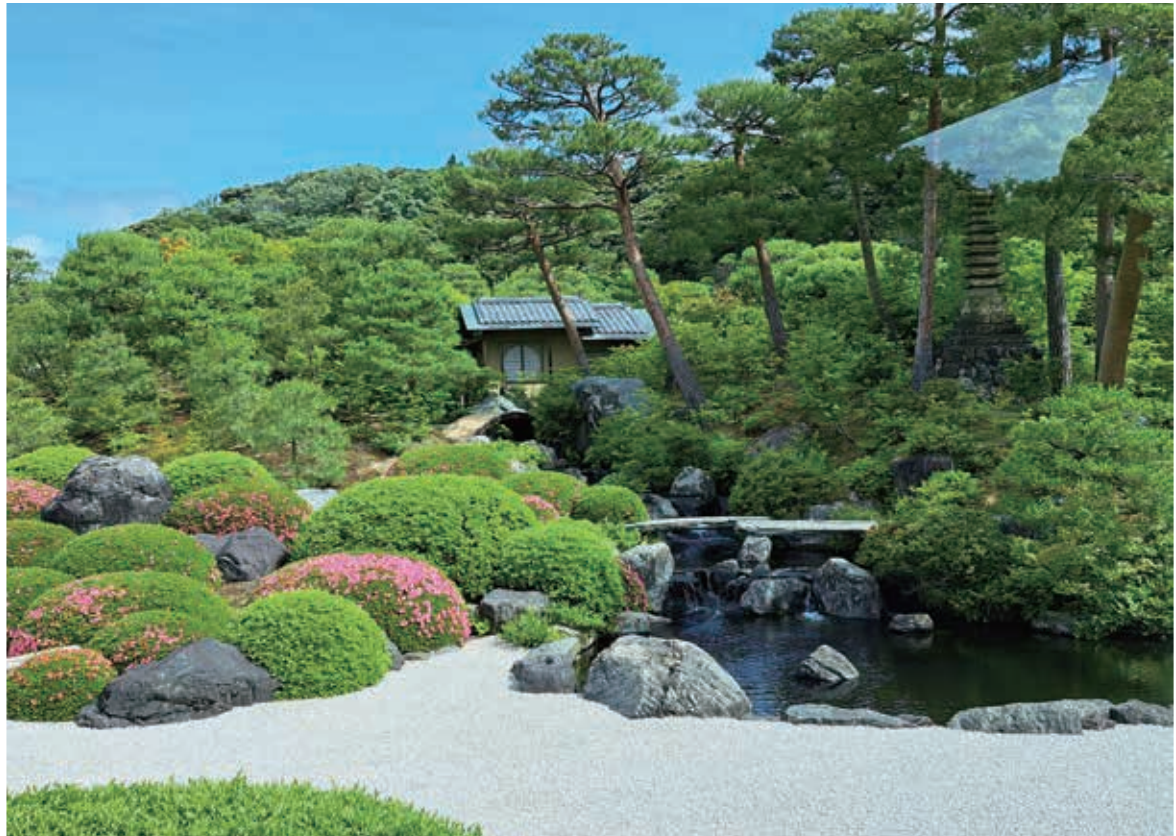
足立美術館（島根県安来市）