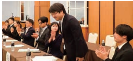
小寺国会議員、国会議員秘書の皆様