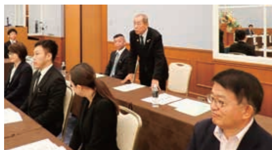
技能士会 清本会長、職能 山極会長