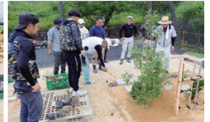
完成後1・2級それぞれに、 本試験に向けた注意事項が指導されました