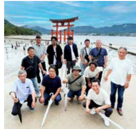
安芸の宮島 厳島神社への研修

令和6・7年度の2年間、東地区長としてお世話になります。 今年度も、東地区会員26社が事業に取り組んでまいります。 既に、今年6月には視察と親睦を兼ねた広島県での研修を行いました。宮島の厳島神社に赴き歴史に触れるとともに、会員の交流を深める良い機会になったと感じております。 また、9月には各市町の防災訓練の参加を予定しており会員の力を注ぐつもりでおります。