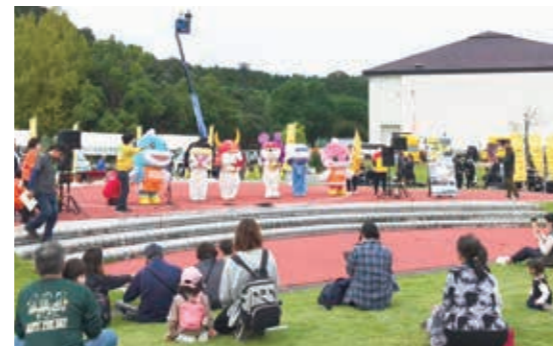
昨年のグリーンフェアひこね