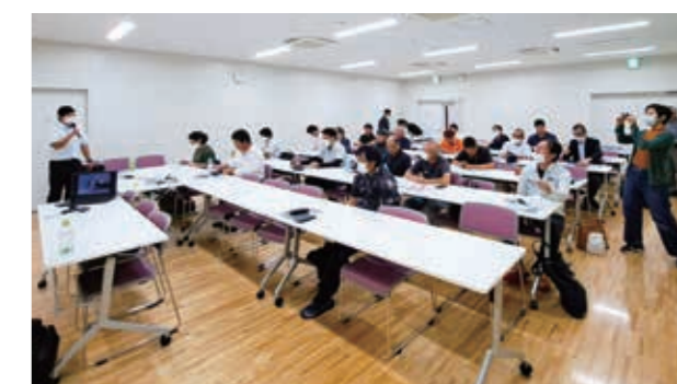
昨年9月8日に開催された講演会(委員長挨拶)

最後になりましたが、会員の皆様のご健勝とご多幸を祈念致しまして、簡単ではございますが就任のご挨拶とさせていただきます。