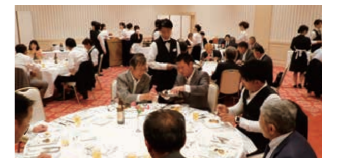
通常総会閉会後の午後5時から懇親会が開催されました