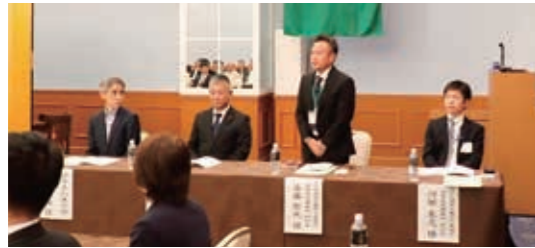
左から北村技監、目片副議長、斎藤副所長、河部副所長