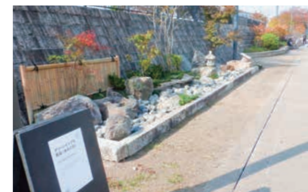
作成後に展示したレインガーデン▲ 雨庭(あめにわ)の紹介▼

今後の委員会活動は委員の方々と一致団結し、みなさまのニーズに沿った活動をしていきたいと考えていますのでよろしくお願いいたします。