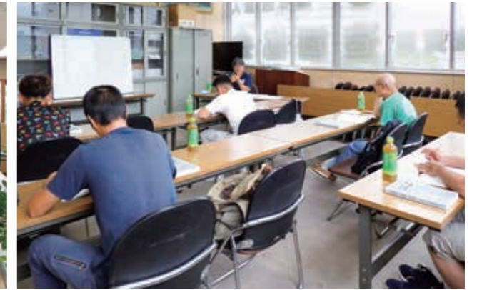
8月8日～11日までの4日間、造園技能検定(学科) 準備講習会が協会会議室で開催されました