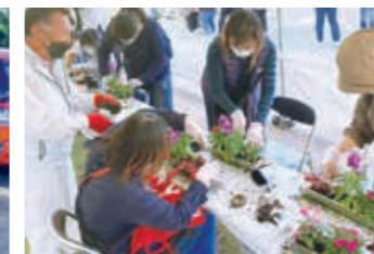
寄せ植え、コケ玉体験