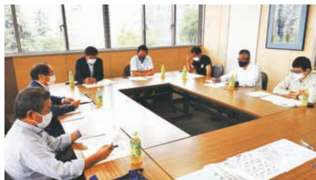
第1回 記念式典実行委員会 開催状況