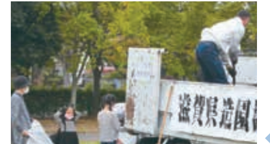
パーク堆肥の無料配布