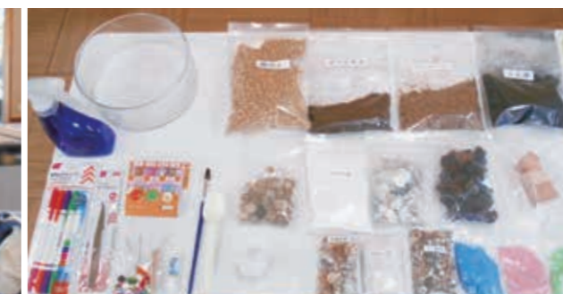
「苔テラリウム」の材料