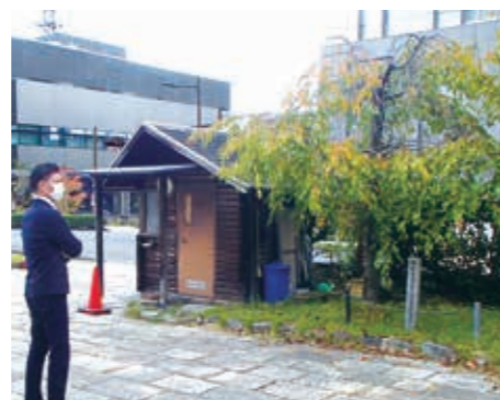
20周年記念植樹の県庁玄関前シダレ桜を視察 (記念植樹箇所の選定)