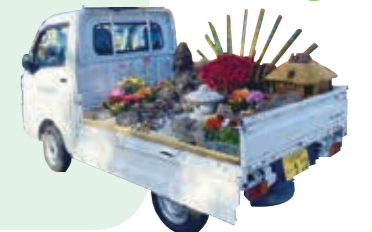
軽トラガーデン展示

今後、会員の皆様の御理解と御協力を得ながら、会員技能の向上のための仕組み作りを進めていきたいと思っていますので、よろしくお祈りします。