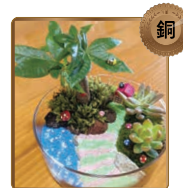
カラフルカラフル