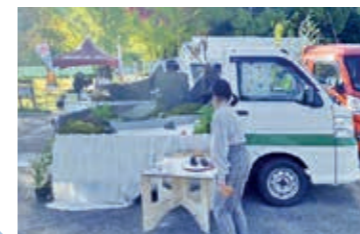
軽トラガーデン展示

今後、会員の皆様の御理解と御協力を得ながら、会員技能の向上のための仕組み作りを進めていきたいと思っていますので、よろしくお祈りします。