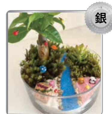
キノコや動物がいてにぎやかだよ