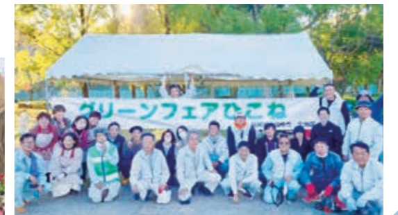
協会メンバー、協力団体の皆さまお疲れ様でした!